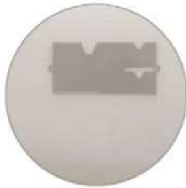
Acrylic bedside card