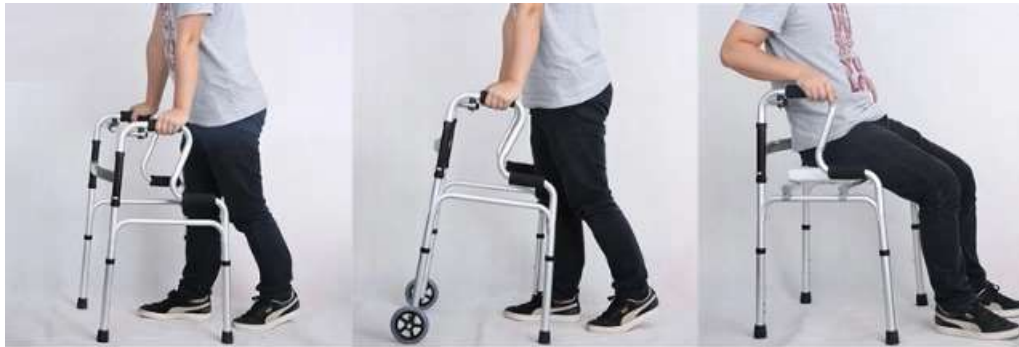
- 普通助行 - GENERAL HELP