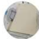
X-Ray board and cassette