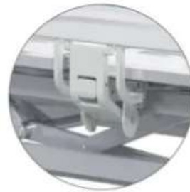
Side rail bracket