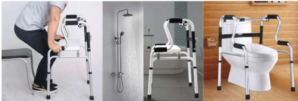
- 累了可坐 - TIRED, SIT