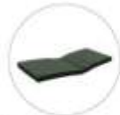
Cool sponge mattress